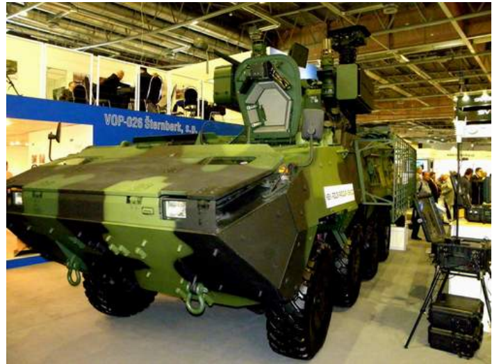
Bojové vozidlo Pandur